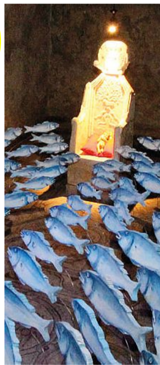
Uno dei presepi esposti a Grado