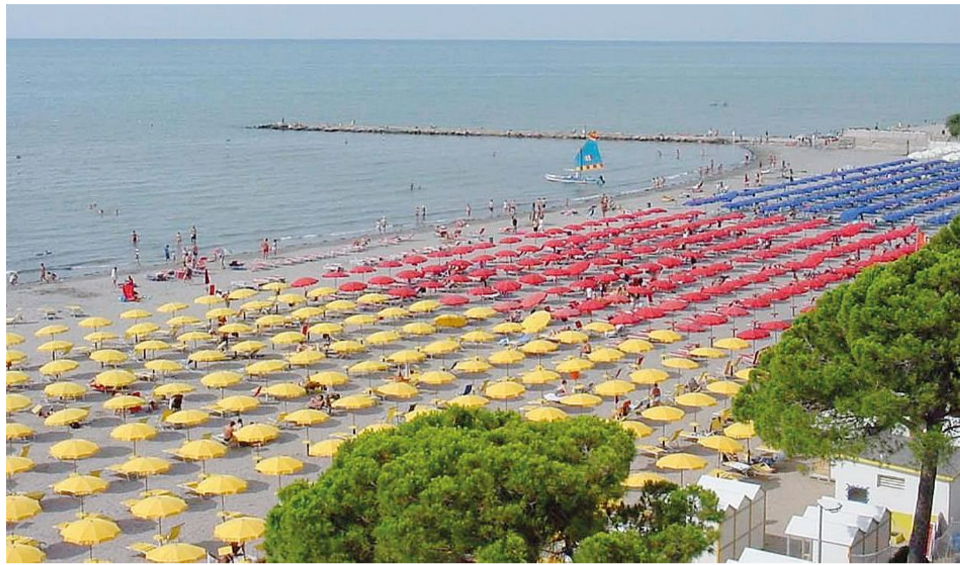
Un'immagine estiva della spiaggia di Grado

Per quel che concerne la spiaggia, l'andamento è condizionato dalle condizioni meteorologiche che quest'anno non sono state molto favorevoli. In particolare settembre